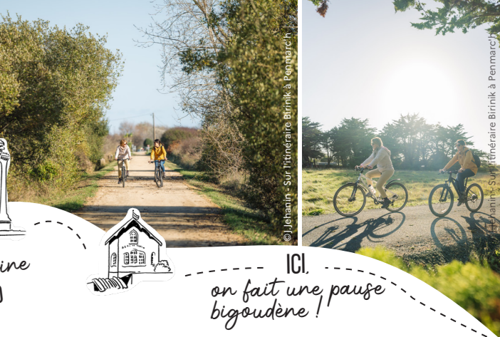
Le patrimoine A VÉLO ICI on fait une pause bigoudène !

Avant d'être un itinéraire cyclable, le Birinik est le surnom donné à la ligne ferroviaire qui desservait Treffiat et les gares de Plobannaec, le Guilvinec, Penmarc'h, Kéry et Saint-Guénéolé.